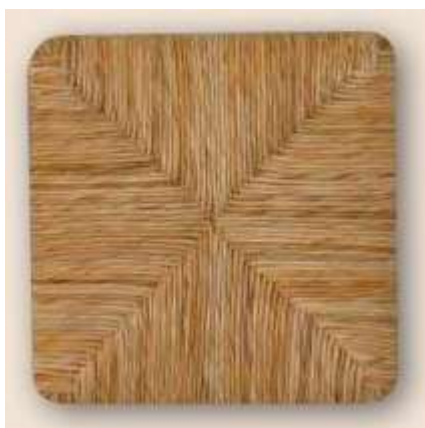
Sedile paglia naturale rossiccia