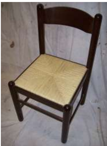
Sedie con sedile sintetico