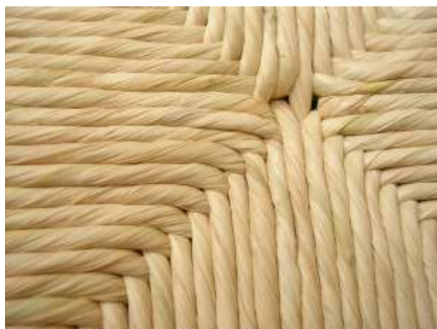
Particolare dell'impagliatura in raffia

Esempi di impagliature a mano in raffia: