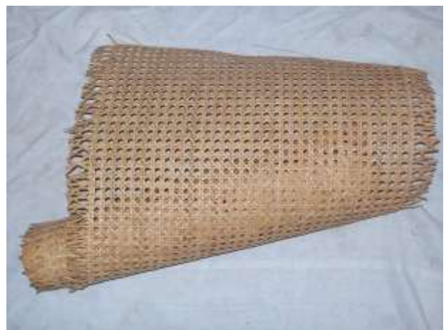
Pannello di trafilato di giunco