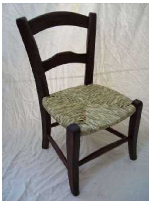
Sedia tradizionale in carice verde