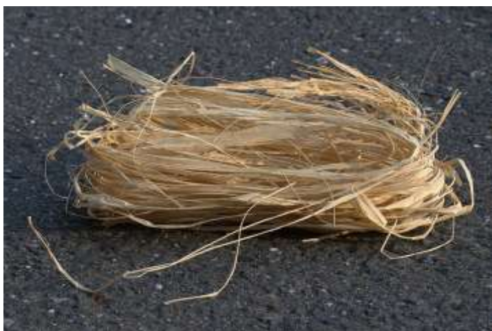
Fili di raffia