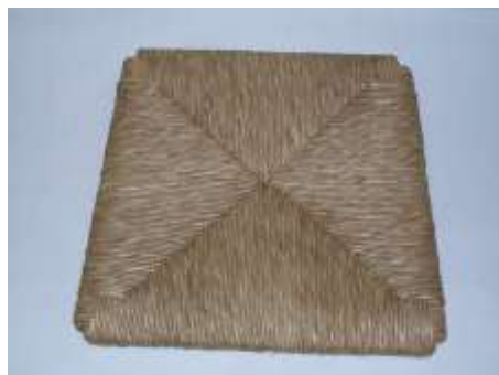
Sedile in paglia naturale verde