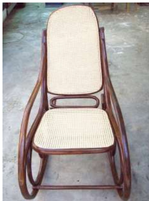
Dondolo vienna a mano