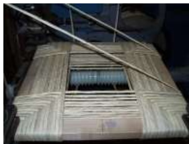
Durante la lavorazione