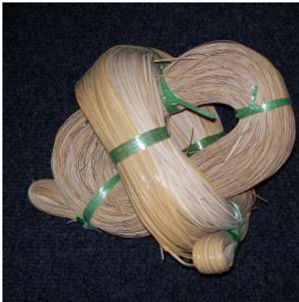
Trafilato di giunco: materiale per la vienna