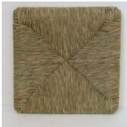
Sedile paglia naturale verde