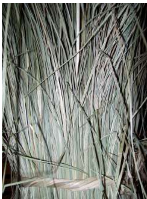
Il carice verde

Mantenendo viva quest'arte portiamo avanti la tradizione dei nostri antenati.