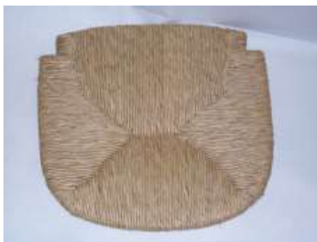
Sedile in paglia naturale verde