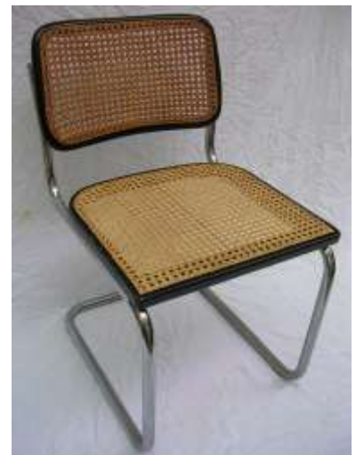
Sedie con sedile e schienale in vienna a mano