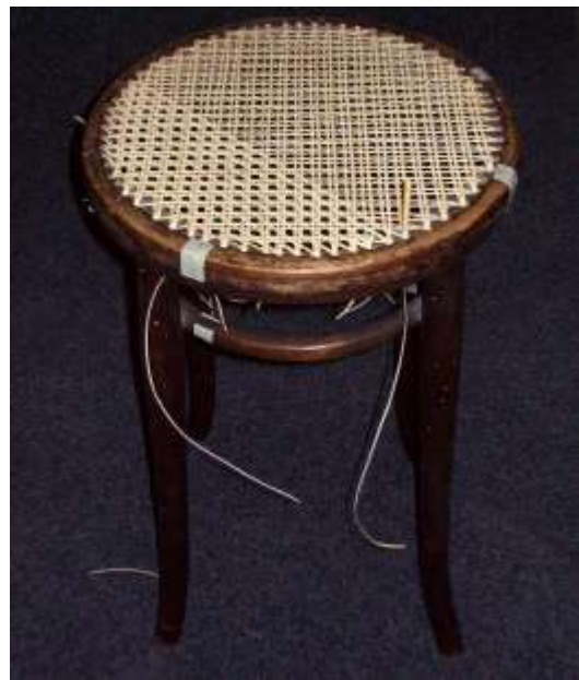
Vienna a mano in lavorazione