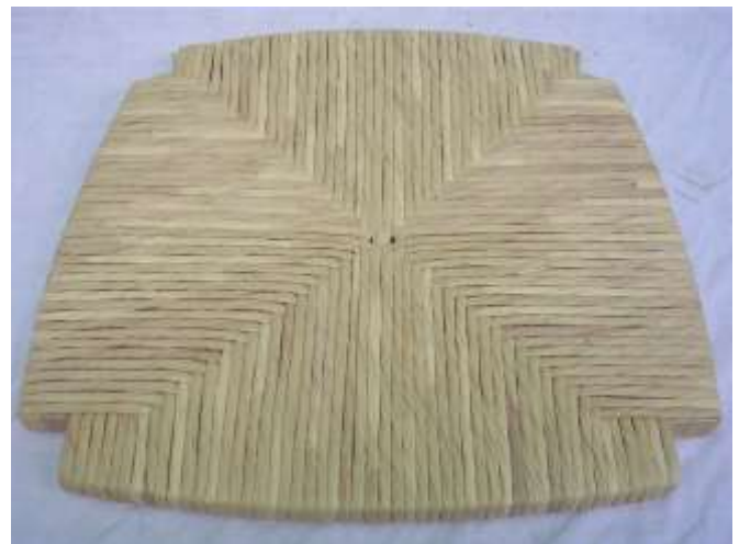
Esempio di sedile sintetico