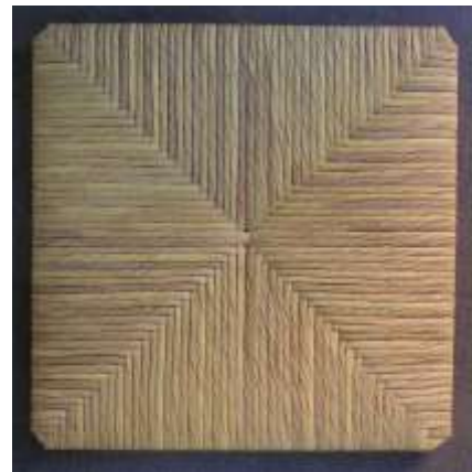
Sedile paglia sintetica mais