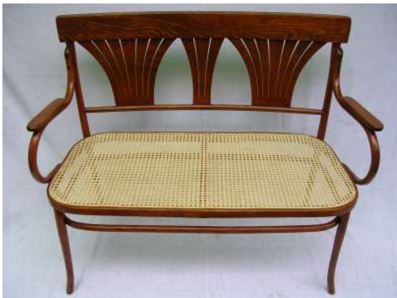
Divano vienna a mano