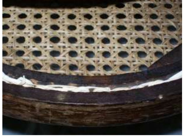
SOTTO LA SEDIA